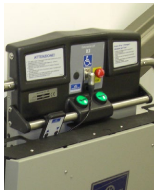
Einfache Bedienung auf Fahrzeug