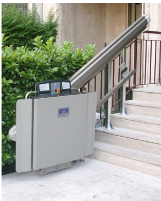
Plattform in Haltestelle oben zusammengeklappt