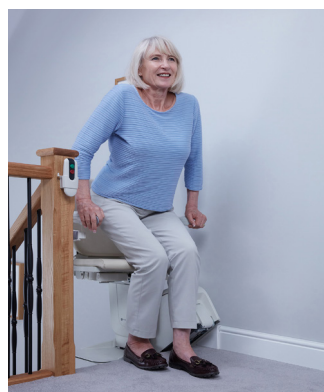
Arrêt en haut - siège tourné sur le palier pour une montée et une descente en toute sécurité