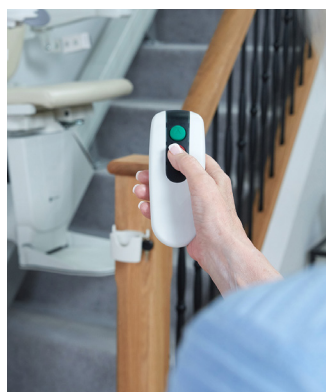
Stations d'appel ergonomiques pour l'appel ou l'envoi du siège