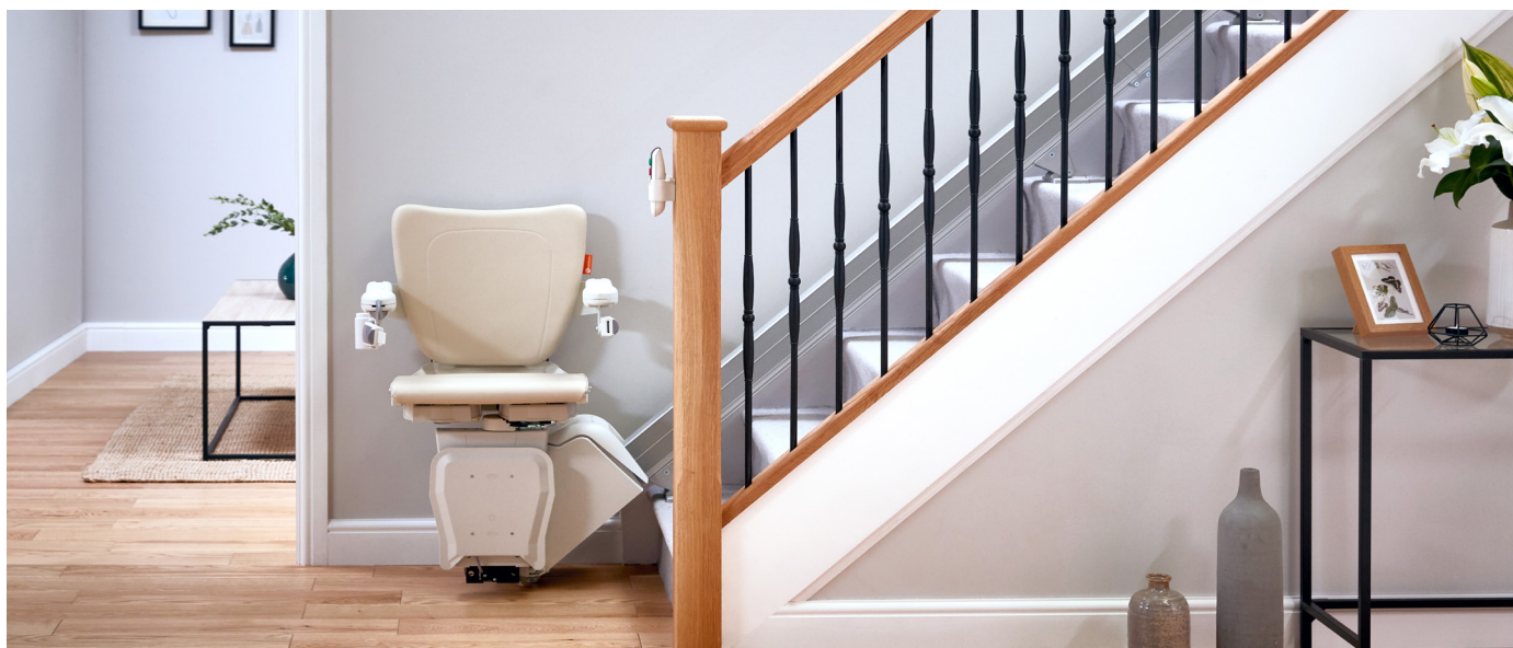
Arrêt en bas