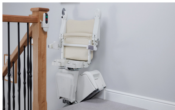
Arrêt en haut - siège relevé - l'escalier est libre