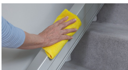
Rail étroit - nettoyage facile

Options Pièce d'écartement supplémentaire pour le support de rail Rallonges de rail jusqu'à 7 m Rail coulissant Pas de sortie en haut Repose-pieds automatique Siège pivotant automatique