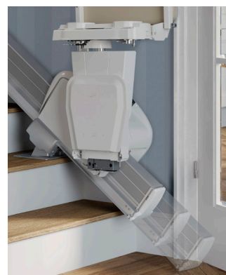
Arrêt en bas - avec option rail coulissant