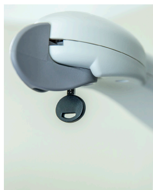
Commande aisée dans chaque accoudoir