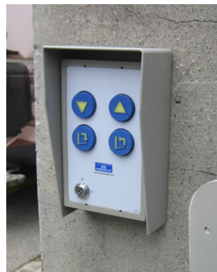
Station d'appel sans fil; aucun câblage