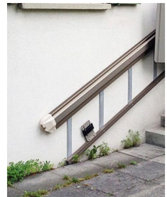
Rail de guidage simple et élégant